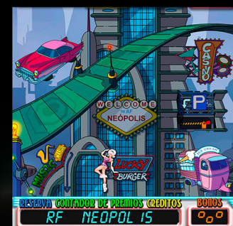
JUEGO "LA CIUDAD"