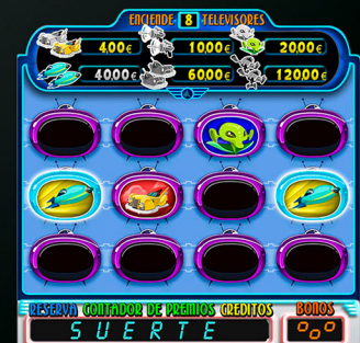
JUEGO DE LAS PAREJAS

Alto Salones: 2123 mm. Alto: 2034 mm. Ancho: 590 mm. Fondo: 680 mm. Peso: 111 Kg.