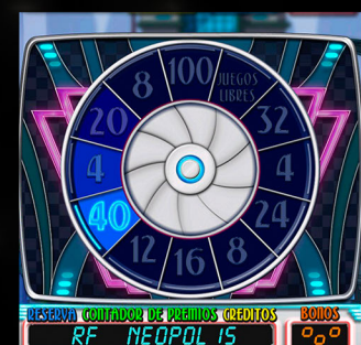
JUEGO "DE RULETA"