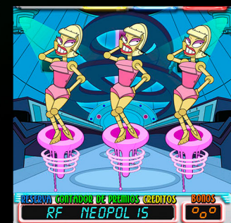
JUEGO "ROBOT FACTORY"